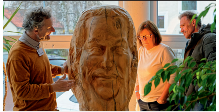
Johannes der Täufer von Magnus Kleine-Tebbe, Material: Walnuss In der rückseitigen Aushöhlung der Büste erscheint ein Jesusbild: Hinter Johannes dem Täufer steht Jesus.

Fotografien und großformatigen Gemälden bis hin zu einer detailgetreuen Kopie von Rembrandts „Nachtwache“. Besonders faszinierten Exponate mit Spiegelflächen, die den Betrachter direkt in das Kunstwerk einbezogen, sowie Skulpturen aus Stein und Holz, die die Geschichte ihres Materials erzählten. Auch kunstvoll gefertigte Quilts und eine moderne Videoinstallation mit Poetry-Slam-Texten zur Frage