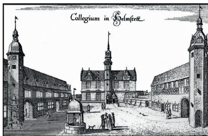
Universität Helmstedt .

stantische Hochschulgründung im deutschen Sprachgebiet nach Marburg (1527), Königsberg (1544) und Jena (1558). Erster Rektor (rector perpetuus) wurde der Erbprinz Heinrich Julius, während dessen späterer Regierungszeit die Universität sich rasch zu einer der angesehensten Hochschulen im deutschen Sprachraum entwickeln sollte, so dass sie in den ersten 40 Jahren ihres Bestehens zu den vier größten im Deutschen Reich zählte und um 1625 sogar als die größte galt.