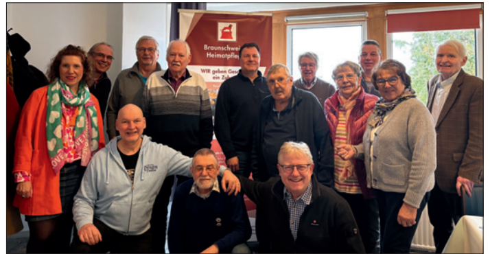
Teilnehmer der Mitgliederversammlung-Gute Stimmung bei den Anwesenden.