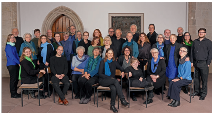
Chor der Musischen Akademie.